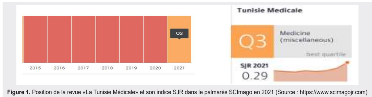
Figure 1. Position de la revue «La Tunisie Médicale» et son indice SJR dans le palmarès SCImago en 2021

de l'Enseignement et de la Recherche Scientifique, en Tunisie) [1]. En effet, dans la dernière version de son site, la position de la revue «La Tunisie Médicale», dans le domaine de la Médecine et dans la catégorie de Médecine Générale, a été déplacée au troisième quartile (Q3), avec un indice SJR (2021) de 0,29 et un Score d'Impact (2 ans) de 0,53 (Figure 1).